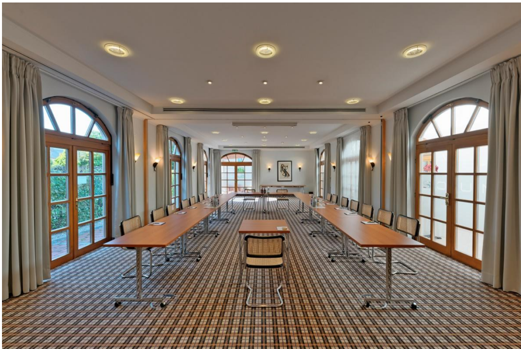
München I + II

Der Raum kann mit Raum München I auf ca. 95m 2 vergrößert werden.